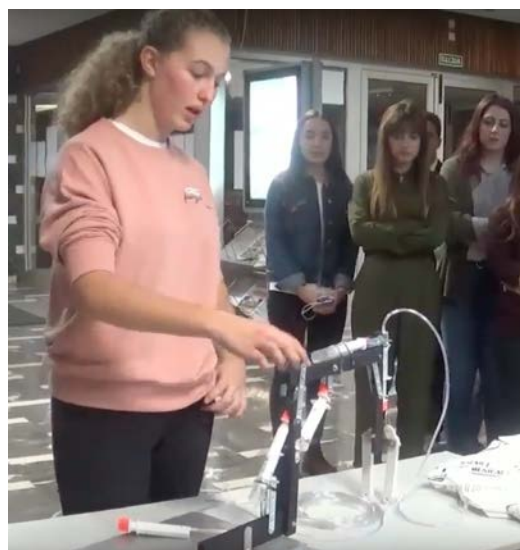
Imagen 4. Brazo Hidráulico desarrollado por estudiantes del Colegio San José